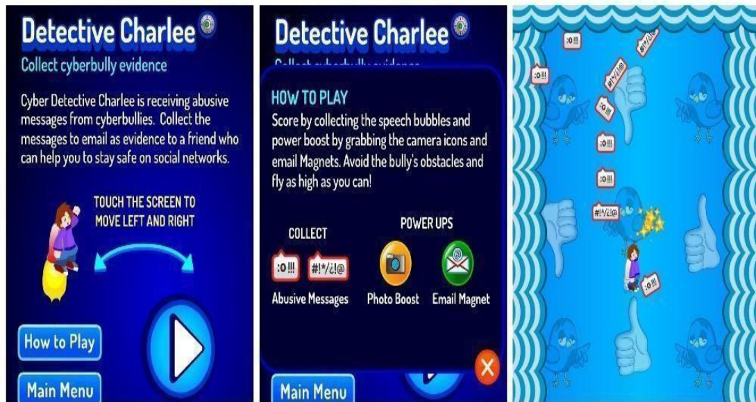
Figura 2. Jogo Detective Charlee

Como Charlee (jogador) poderá resolver essa situação? Ele não pode deixar que os ícones que aparecerão lhe atinjam, para isso Charlee deverá prestar atenção quando aparecer a mensagem que avisa para ter cuidado com os obstáculos. Quanto mais balões coletados, mais rápido fica o personagem, além de contar com poderes como a foto, que serve como um escudo de proteção e o e-mail que puxa todos os balões como um ímã, ambos potencializam também a velocidade do detetive.