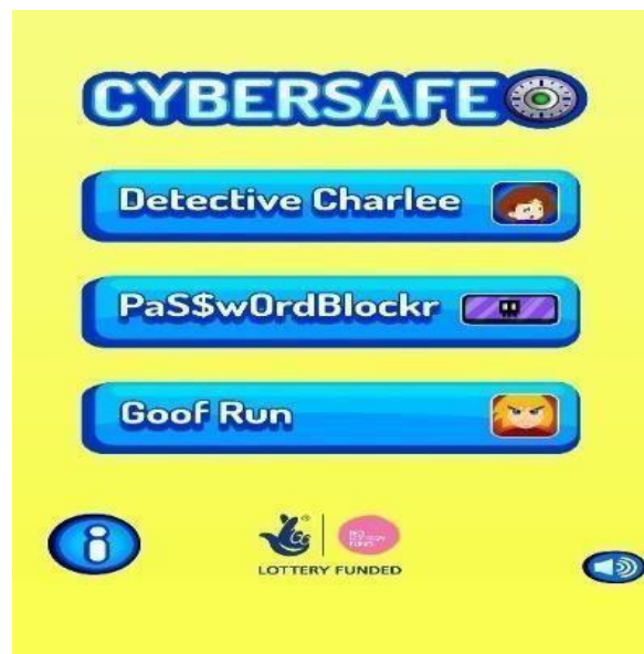
Figura 1. Página inicial do jogo

O aplicativo conta os jogos: Detective Charlee, PaS$w0rdBlockr e Goof Run. Cada jogo tem uma especificidade a ser tratada. Pode-se observar que os desenvolvedores tiveram como ponto principal a segurança de navegação na Internet, enfatizando medidas de como agir perante as ocorrências da violência virtual. Na figura 1, é exibida a página inicial, em que pode-se encontrar os três jogos.