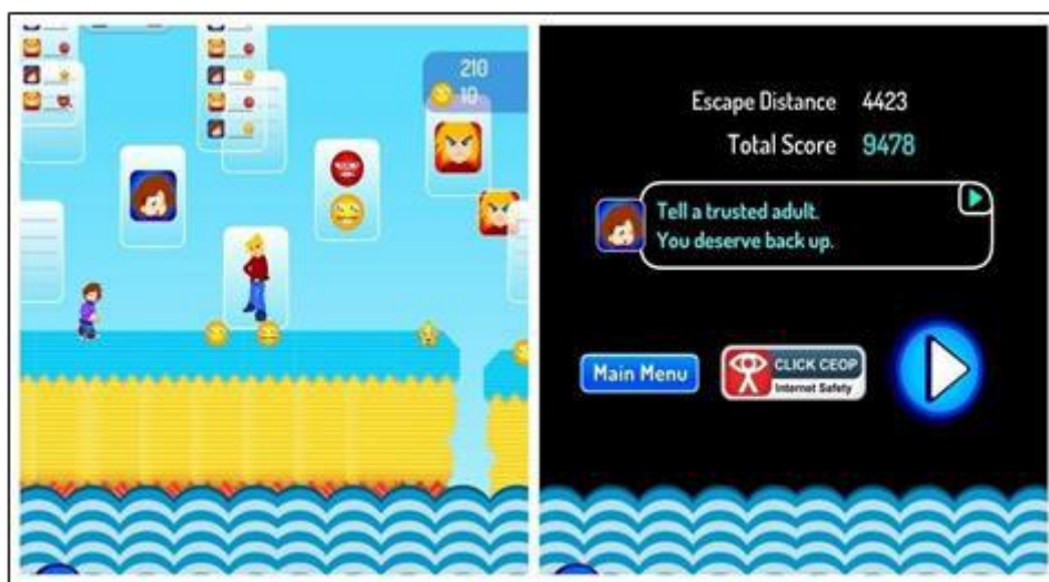
Figura 8. Desenvolvimento do jogo Goof Run

O objetivo desse jogo é ajudar a Charlee a se manter seguros nos grupos de bate-papo, para isso é necessário pegar o máximo de emoji com carinha feliz e superar os obstáculos. Para além do jogo digital, a intenção é de promover a empatia nos jogadores, para que eles possam ajudar seus colegas que são vítimas reais do cyberbullying e também a não se juntarem com os agressores. Para as vítimas, a mensagem do jogo é de que sempre deve-se conversar com alguém sobre as agressões virtuais.