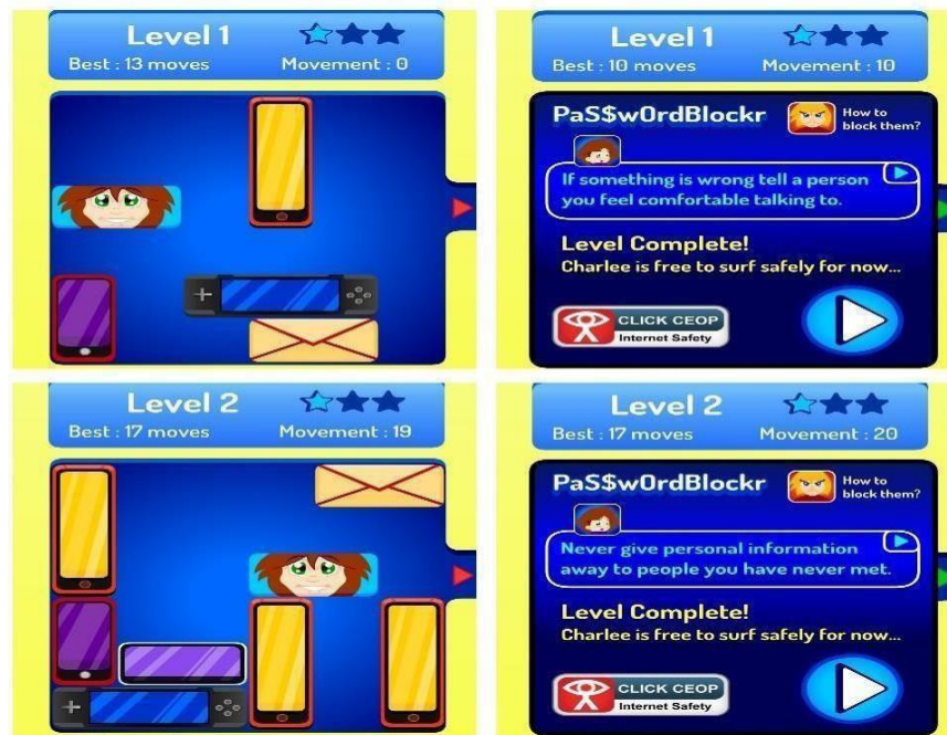
Figura 5. Jogo Pas$wOrdBlockr

Para solucionar o problema da vítima, o jogador precisa desbloquear a sua passagem até o final da fase, ficando atento ao funcionamento dos obstáculos do jogo, pois existem formas específicas de movê-los. Portanto, é necessário pensar em estratégias de como conseguir avançar para a seguinte etapa, sendo que a cada nível, o grau de dificuldade vai aumentando.