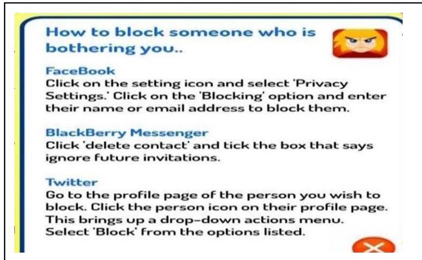
Figura 6. como bloquear alguém que incomoda na Internet

Nesse jogo, pode-se visualizar na parte superior no canto direito um ícone com: how to block them? (como bloquear eles?), que ao clicar aparece o texto exposto na figura 6, mostrando formas de bloquear os agressores no Facebook, BlackBerry Messenger e Twitter.