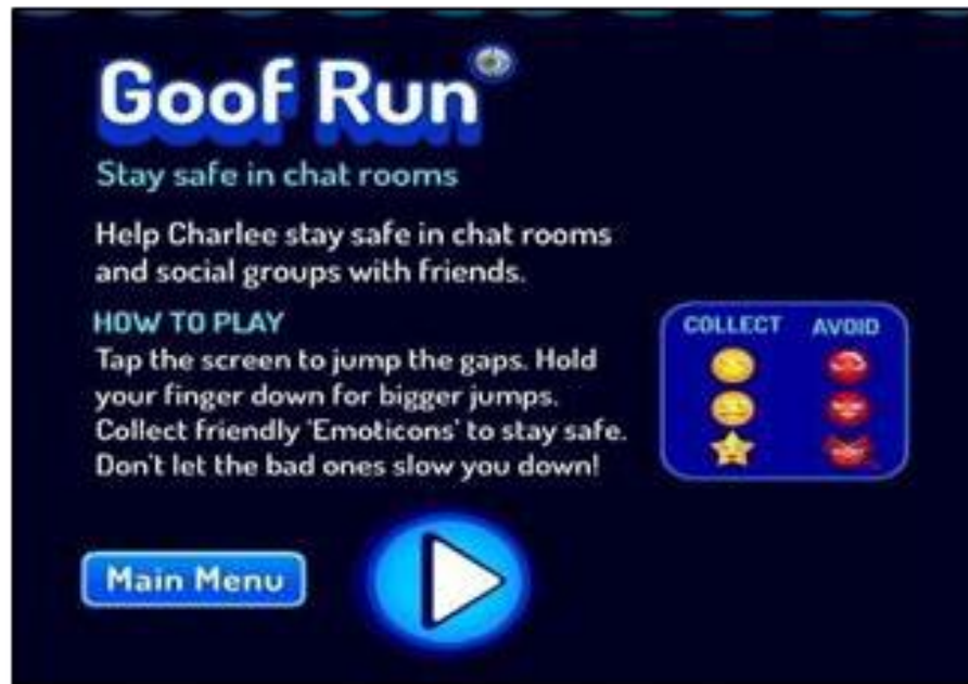
Figura 7. Jogo Goof Run

O objetivo desse jogo é ajudar a Charlee a se manter seguros nos grupos de bate-papo, para isso é necessário pegar o máximo de emoji com carinha feliz e superar os obstáculos. Para além do jogo digital, a intenção é de promover a empatia nos jogadores, para que eles possam ajudar seus colegas que são vítimas reais do cyberbullying e também a não se juntarem com os agressores. Para as vítimas, a mensagem do jogo é de que sempre deve-se conversar com alguém sobre as agressões virtuais.