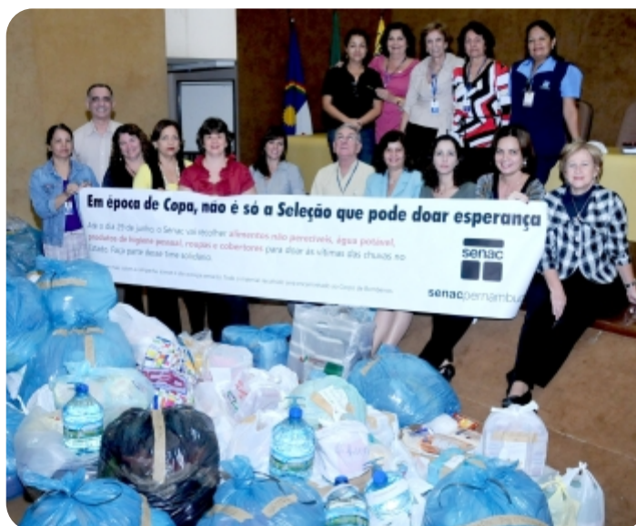
■ Funcionários do Senac recolheram alimentos não perecíveis, água potável, produtos de limpeza e higiene pessoal, roupas e cobertores

comércio local –, garantiu o sucesso da iniciativa, apesar da evasão provocada pelos jogos da Copa do Mundo e pelo feriado prolongado de São João. “Foram dias de bastante trabalho, inclusive com viagens aos locais mais atingidos para avaliar os prejuízos”, reforçou.