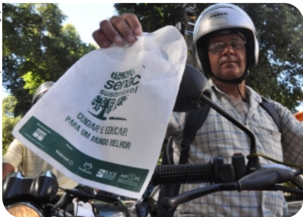
■ A distribuição de sacolas de lixo reutilizáveis foi uma das ações realizadas durante o Senac Sustentável, nos dias 8 e 9

Cerca de 1,2 mil pessoas, entre alunos e funcionários, participaram do Senac Sustentável, evento realizado nos dias 8 e 9 de junho em comemoração ao Dia Mundial do Meio Ambiente. Com o tema "Cuidar e Educar para um Mundo Melhor", a programação incluiu uma mostra cinematográfica, diversas palestras e uma exposição fotográfica. A ocasião também marcou o lançamento de parcerias do Senac com empresas de reciclagem.