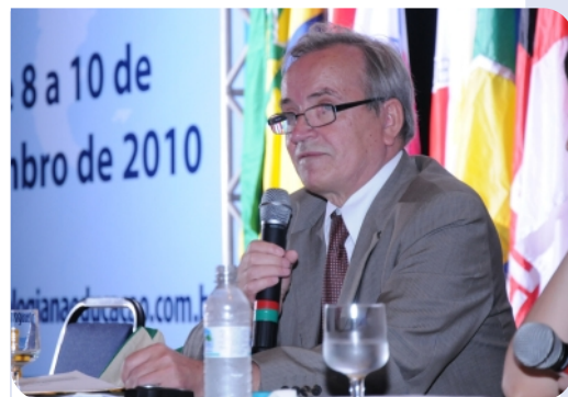
▣ Metodologia de ensino empregada na Finlândia foi mote de conferência internacional realizada no dia 9