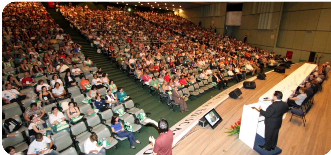
■ A educação como premissa para a formação de um cidadão voltado para o mundo foi o mote das discussões do evento deste ano